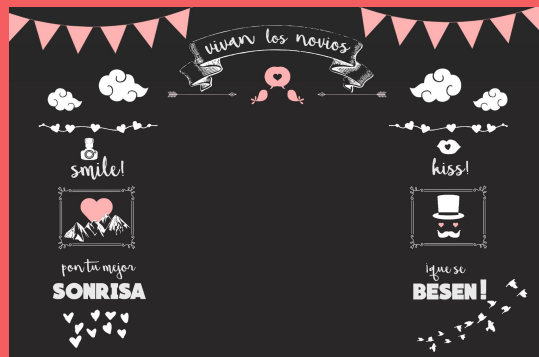
Lona "Vivan Los Novios"